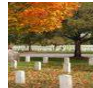
Beneficios de Entierro