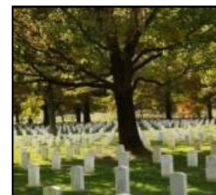
Repatriation and Burial